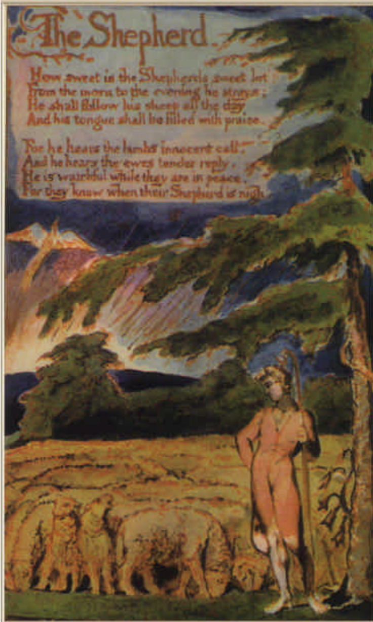
Ilustración de William Blake para El Pastor, en Cantares de Inocencia (1789)