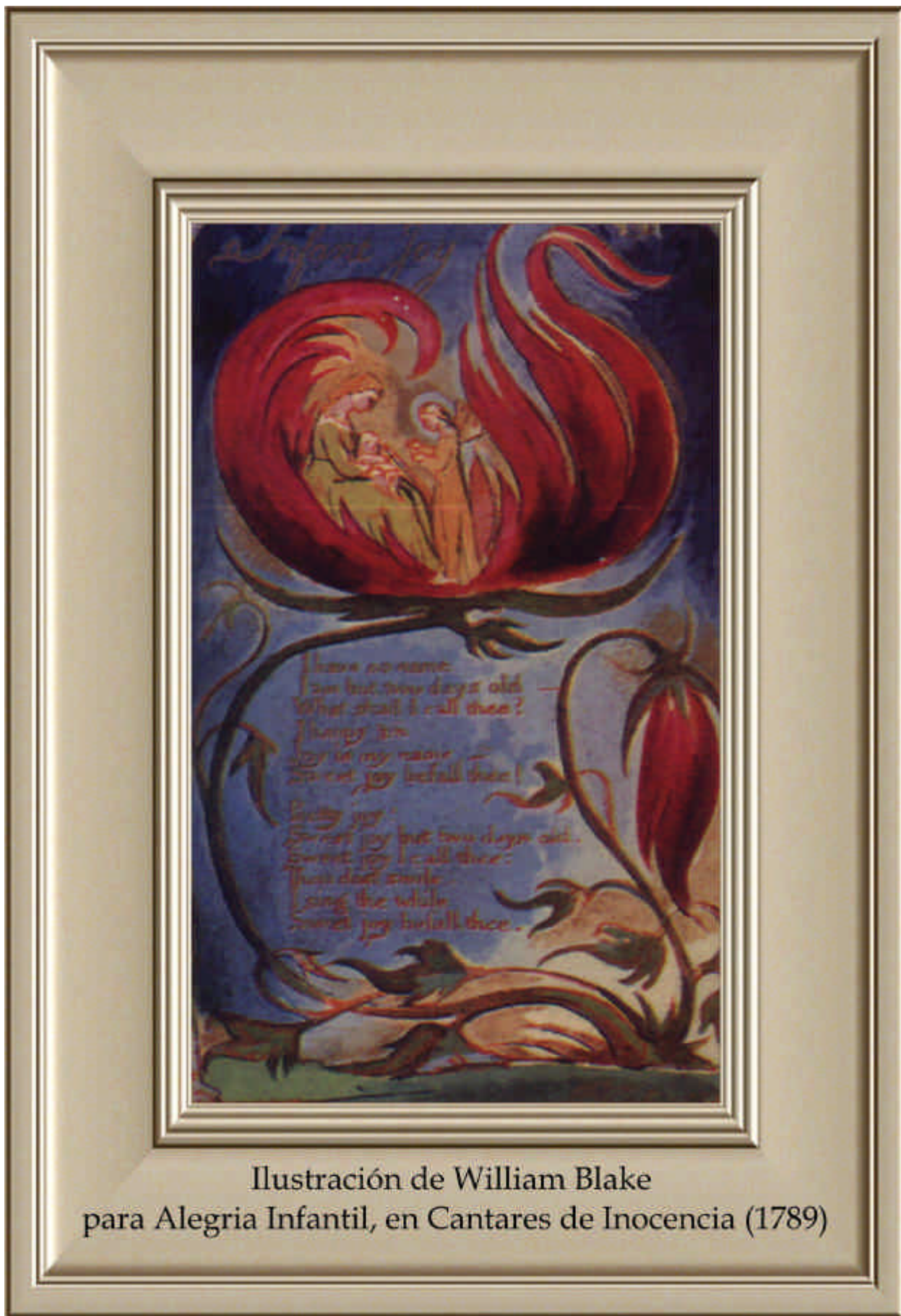
Ilustración de William Blake para Alegria Infantil, en Cantares de Inocencia (1789)